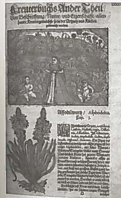
32. Tav. in A. Lonitzer 1598, p. 89.