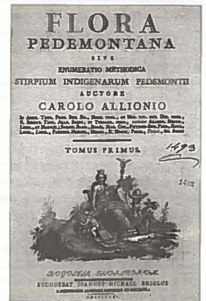
33. Frontespizio di C. Allioni, Flora pedemontana , 1785.