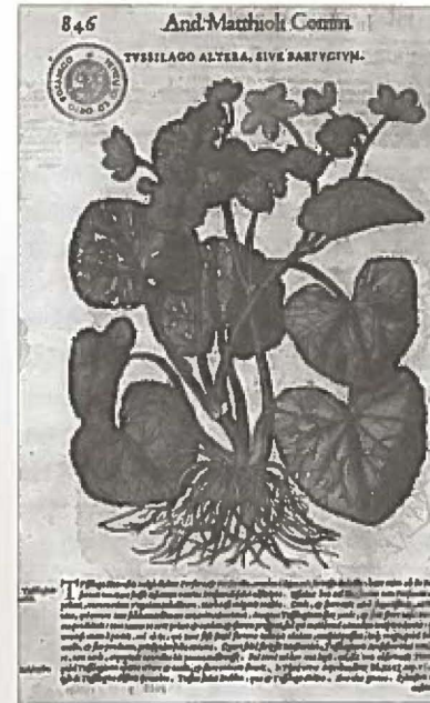
30. Tav. in Mattioli 1565, p. 846.